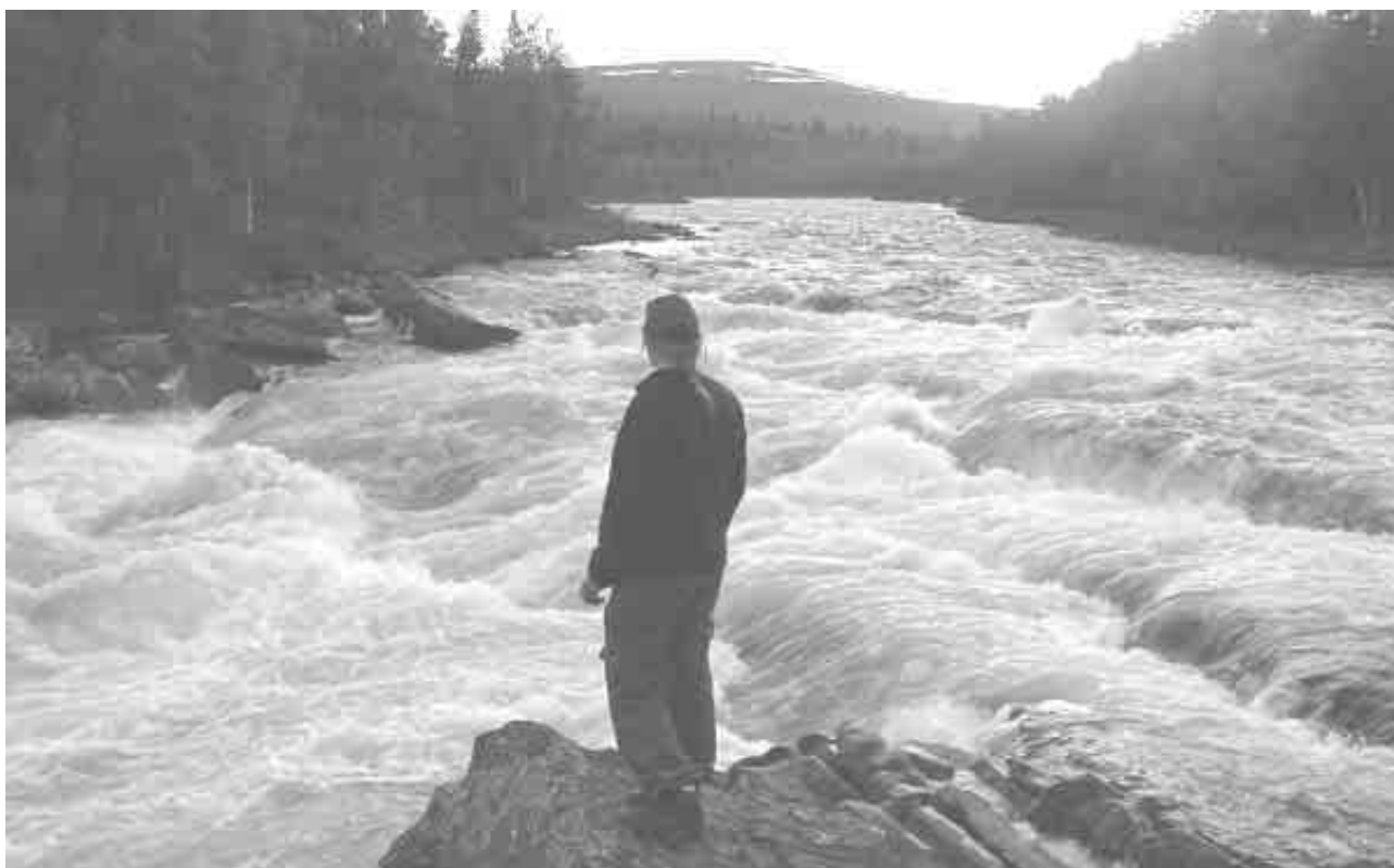
Vindelølv, en imponerende "sjat" vand, der bedøver både øje og øre.

Eksempelvis Skandinaviens, hvis ikke verdens nordligste kartoffelmark i form af en kunstig sydvendt høj bakke, hvor byens familier hver har et lille lod på den 45 grader skrånende bakke. Selv midt i byen er naturen værd at følge. Et hvert besøg i den lille landhandel kræver bevæbning med kikkert og kamera og god tid. En syngende Blåhals ved kirken, ynglende Hvinænder i byens lille gadekær eller Vendehals i en