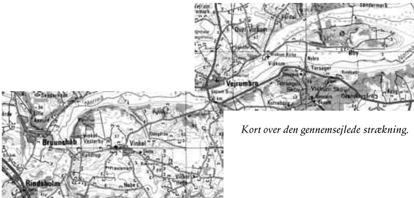
Kort over den gennemsejlede strækning.