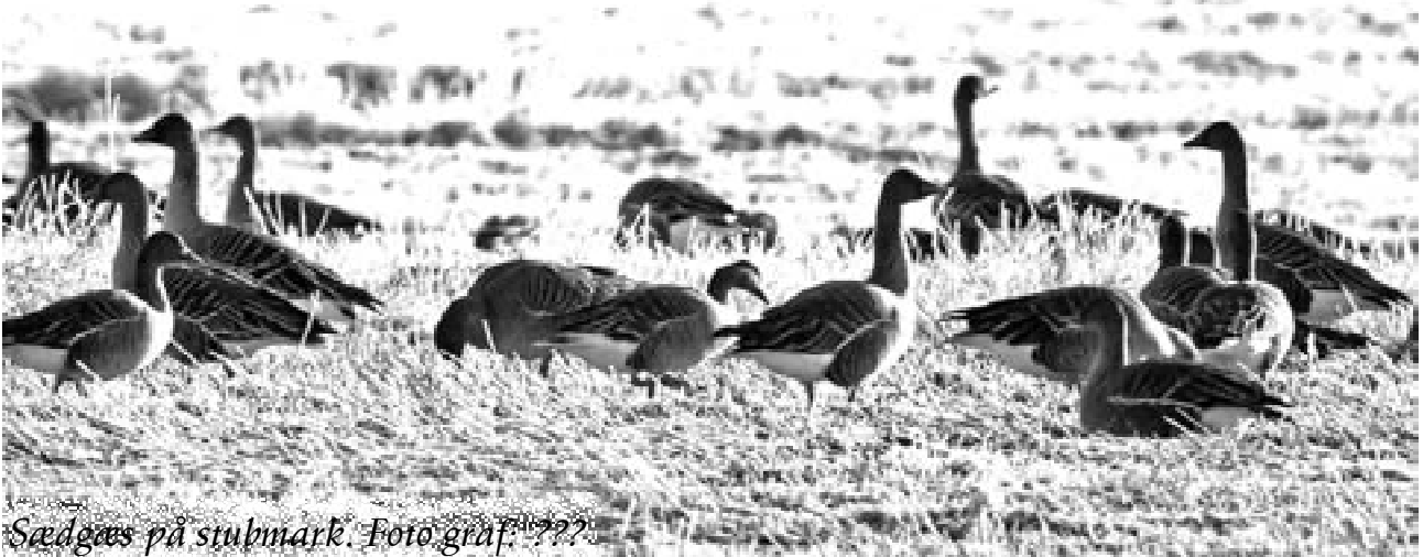
Sædgæs på stubmark. Foto graf.???

Lige et smut udenfor Himmerland. Tjele er taget med, fordi det ligger tæt på Himmerland og er vigtig for Sædgæssene ved Lille Vildmose. Jeg regnede med, at der skulle skrives en nekrolog over Sædgæssene ved Tjele Langsø.