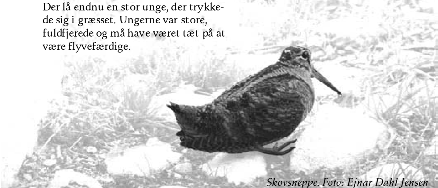
Skovsneppe.