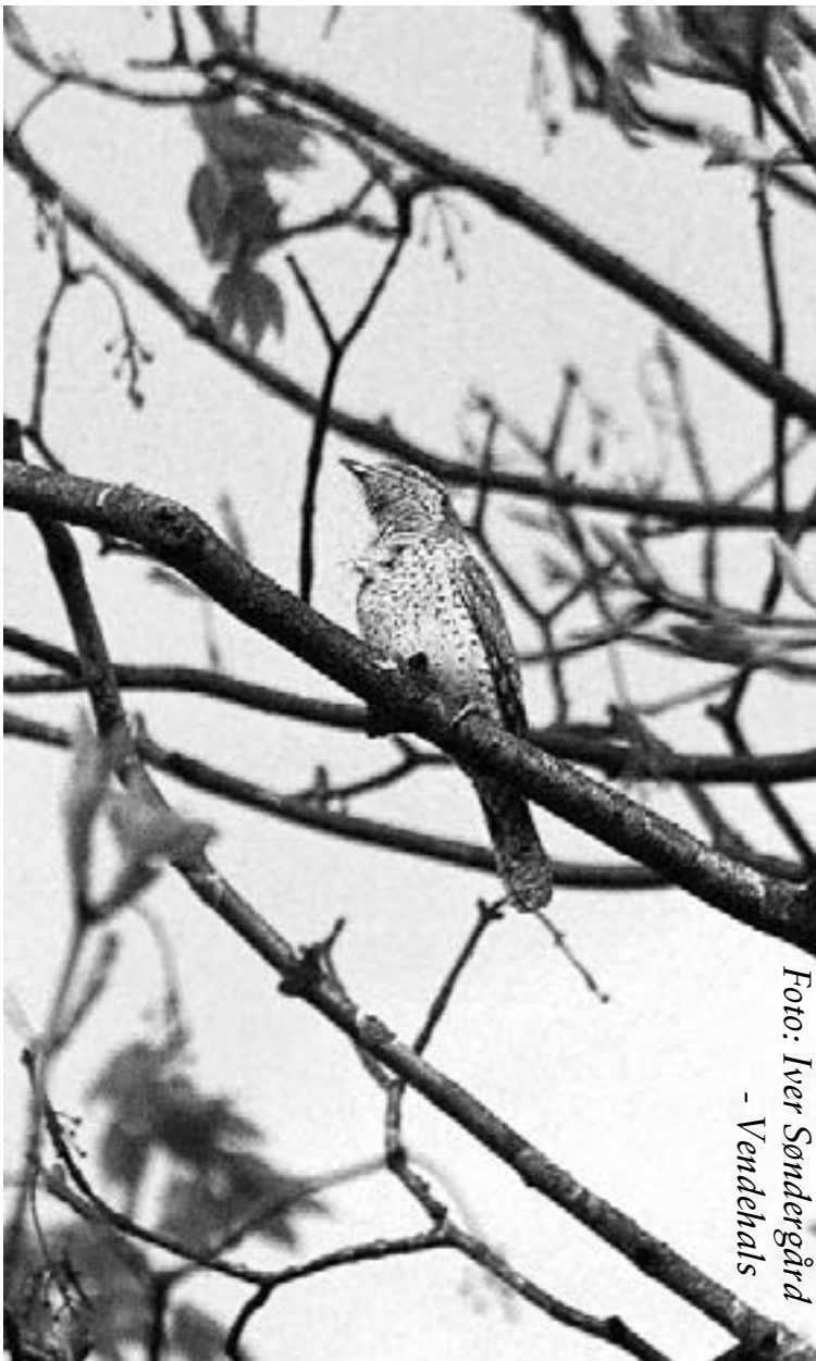
Vendehals