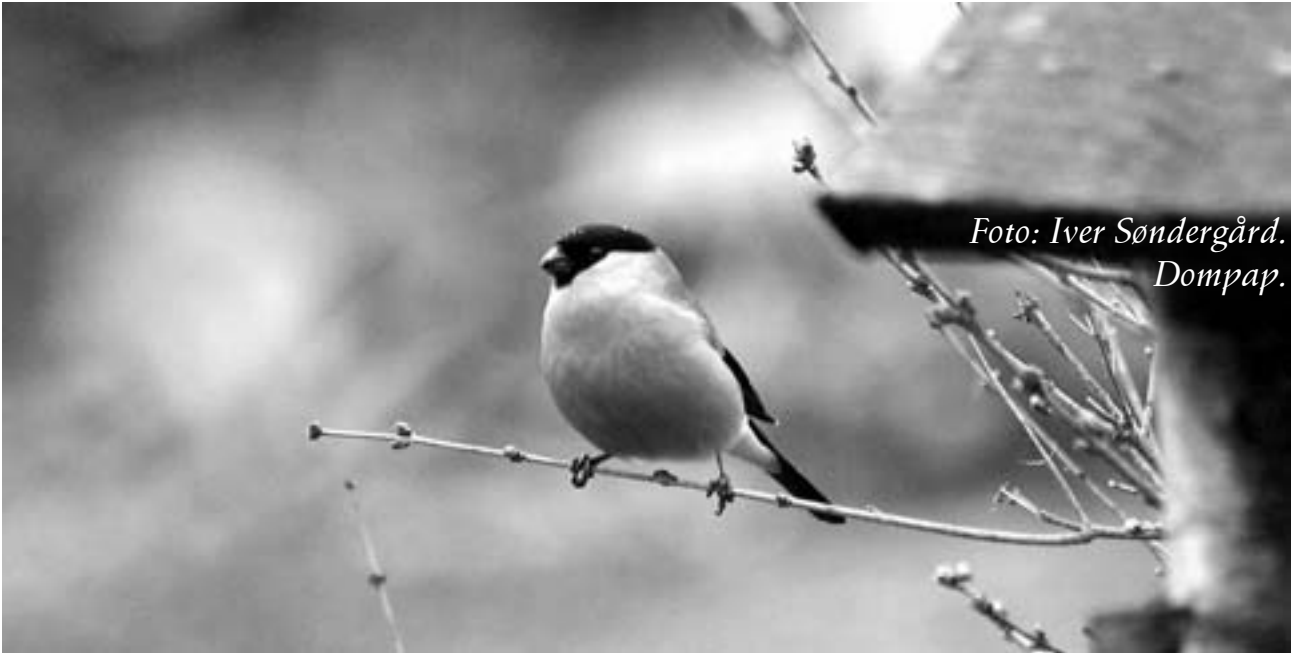
Dompap.

Fedtet kan serveres rent, men bollerne bliver kun bedre, hvis der også tilsættes lidt godt. Solsikkefrø, hampefrø, hakkede jordnødder og vildfugleblanding er gode sager. Bemærk, at de billige vildfugleblandinger indeholder mange hvedekerner, som kun de færreste fugle gider spise. En del af fedtet kan med succes erstattes med usaltet jordnøddesmør. Man kan også tilsætte rosiner eller anden tørret frugt, der især vil glæde droslerne. Lidt knust æggeskal giver fuglene et kalktilskud.