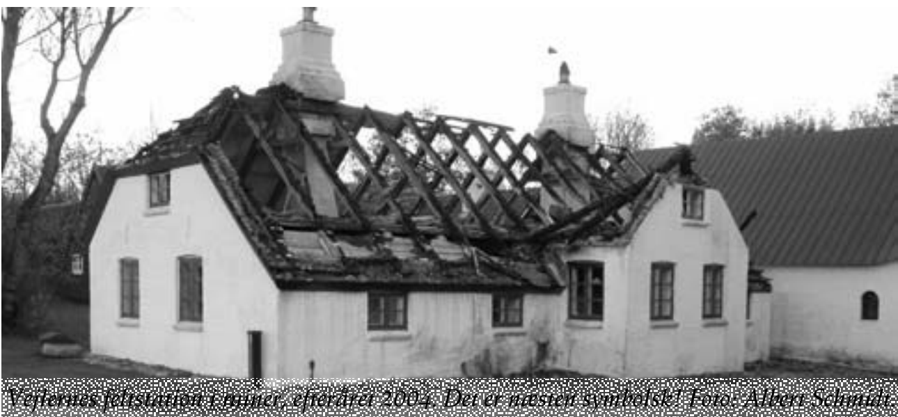
Vejlernes feltstation i ruiner, efteråret 2004. Det er næsten symbolsk!