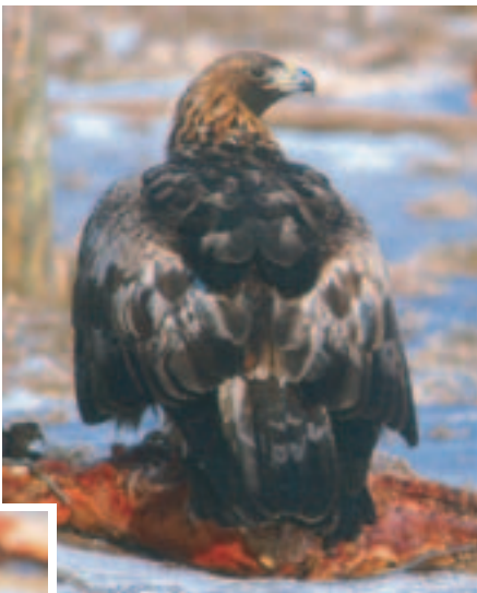
▲ Foto 25 & 26. Ringmærket med kendt alder. Stort set helt udfarvet. Smalle, gråhvide striber kan stadig ses på nogle af halefjerenes yderfane. Dette individ har i modsætning til det forrige et lyst felt i vingedækfjerene og følger således ikke (længere ??) sekvensen med hvert andet år lyst og hvert andet år mørkt felt.