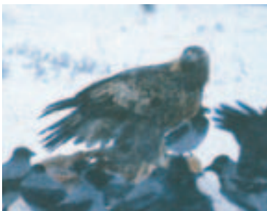
Foto 23. Samme ørn som på foto 13 men nu to år ældre. Følger også sekvensen med lyst – mørkt felt på vingedækfjerene (her lyst). Halen er overvejende adulttegnet, men lyse striber kan anes på fotoet trods vinklen.

Foto 22. Samme individ som på foto 19 – 21 men nu et år ældre. Vingeoversiden har nu et centralt beliggende lyst felt på dækfjerene (ikke-fældede og slidte fjer). Sekvensen med hvert andet år lyst felt og hvert andet år mørkt følges stadig. Rækken af de store dækfjer er et sammensurium af gamle og nyfældede fjer. På billedet ser det ud, som om halen er mørk og adulttegnet undtagen på det midterste par fjer, der stadig har en del hvidt basalt (dækkes på billedet til dels af vingen). Set flyvende kunne denne ørn let fejlbestemmes til at være i fjerde dragt.