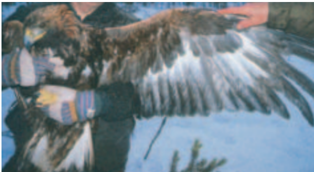
◀ Foto 15. Samme fugl som foto 14. Typisk vingeunderside. Det hvide felt i dækfjerene er delt af mørke adultlignende hånd- og armsvingfjer. Gulbrune små armdækfjer (optræder allerede i tredje dragt). Halefjerene er adulttegnede indenfor terminalbåndet, men stadig ret hvide.