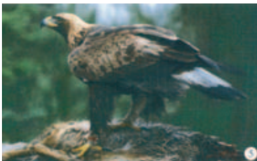
Foto 5. Ringmærket med kendt ► alder. Typisk tegnet fugl. Gennemgående lyse (slidte og afblegede) øverste små og mellemste armdækfjer med indslag af enkelte mørke (nyfældede) fjer. Hele rækken af store armdækfjer ensartet farvet med noget lysere kanter (slitage). Tydelig grå plet i det hvide på en af halefjerene (ikke usædvanligt).

Halen ligner stadig i princippet juvenilhale og en del individer har endnu ikke fældet nogen halefjer. Hvis der er skiftet nogle fjer (ofte parret i midten), har disse gerne grå/gråhvide kiler fra det mørke endebånd ind mod kroppen. Hos enkelte individer er disse mørke tegninger så fremtrædende, at de kan ses på relativt stor afstand under gode observationsforhold. Der findes bevis for at nyudsiftede vinge- og halefjer allerede hos ørne i sin anden dragt i meget sjældne tilfælde kan have tværstriber (se foto 7).