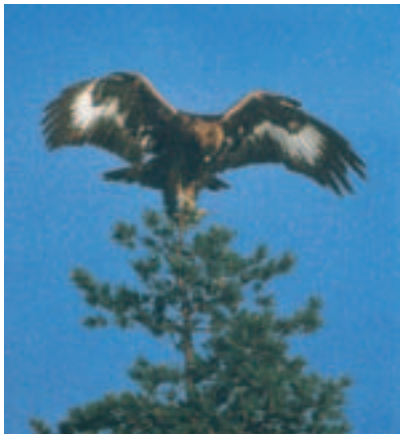
Foto 21. Ringmærket med kendt alder. Samme individ som på foto 19 og 20. Umiddelbart kan ørnen forveksles med en yngre fugl. Et nærmere eftersyn afslører dog, at arm- og håndsvingfjer har tydelig adulttagnet yderdel, samt at mange af svingfjerens yderfaner er mørke helt ind mod basis. På en helt udbredt vinge ville man kunne se tydelige, mørke kiler og hak i det hvide felt i vingen. (Når vingen holdes bøjet som på billedet, dækkes den mørke yderfane næsten af den næste svingfjers lyse inderfane).