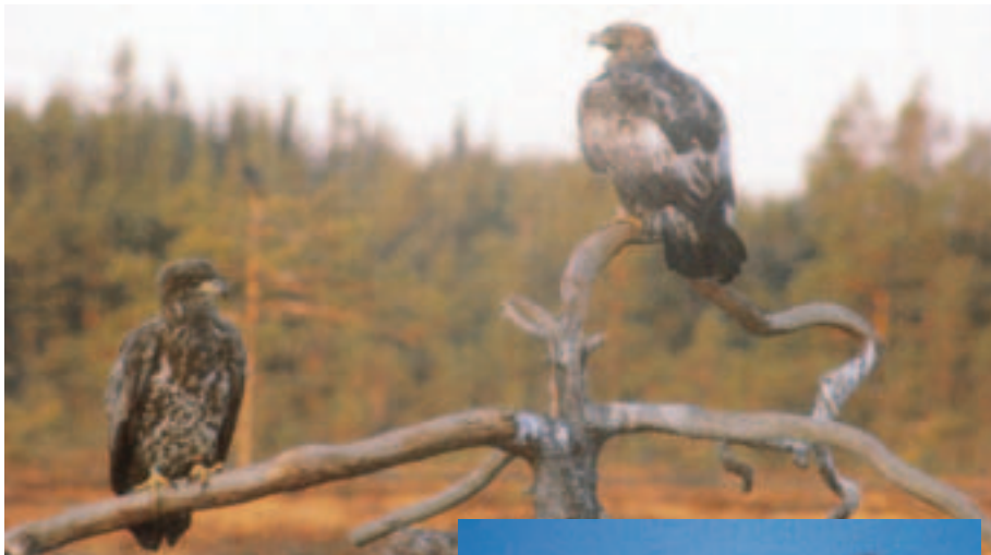
▲ Foto 27. Tiende dragt. Ringmærket med kendt alder. Har stadig en del hvidt ved basis af halefjerene. Til venstre en yngre Havørn.