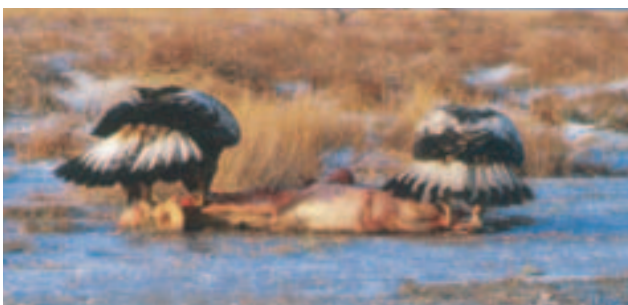
◀ Foto 17 (til venstre). Fuglen viser almindelig haletegnning for denne aldersklasse. Indenfor det mørke terminalbånd ses en begyndende adulttegnning, bedst synlig på de to midterste fjer, der udgør en mørk kile. Læg mærke til, at de store armsvingfjer på vingeoversiden er

af forskellig alder. Til højre en fugl i anden dragt, der er aldersbestemt vha. de ensfarvede (samme alder) store armdækfjer.