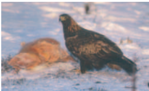
Foto 22. Samme individ som på foto 19 – 21 men nu et år ældre. Vingeoversiden har nu et centralt beliggende lyst felt på dækfjerene (ikke-fældede og slidte fjer). Sekvensen med hvert andet år lyst felt og hvert andet år mørkt følges stadig. Rækken af de store dækfjer er et sammensurium af gamle og nyfældede fjer. På billedet ser det ud, som om halen er mørk og adulttegnet undtagen på det midterste par fjer, der stadig har en del hvidt basalt (dækkes på billedet til dels af vingen). Set flyvende kunne denne ørn let fejlbestemmes til at være i fjerde dragt.