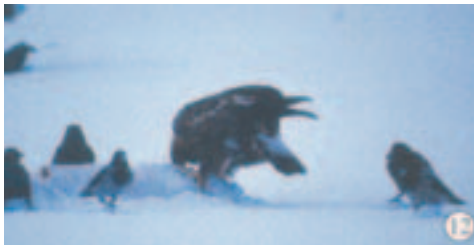
Foto 12. Ringmærket med kendt alder. Dette individ har stadig forholdsvis mange afblegede fjer siddende på vingeoversiden, bl.a. den bageste række af små armdækfjer. Samme farvetegning kan tænkes opstå hos ørne, der skifter forholdsvis mange små armdækfjer allerede ved første fældning (se foto 8). Ellers ses den for tredje dragt typiske lyse række af store armdækfjer centralt på vingen. De nyfældede ydre halefjer er usædvanligt mørke med adultlignende tegninger.