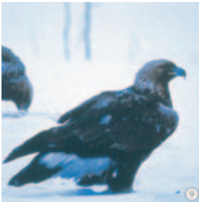
Foto 9. Ringmærket med kendt alder. Typisk tegnet fugl. De fleste af vingeoversidens små og mellemste armdækfjer er fældede og mørke. Typisk er desuden rækken med slidte og meget afblegede, centralt beliggende store armdækfjer (ofte 5-7). Dette individ har stadig juvønnillignende haletegning.