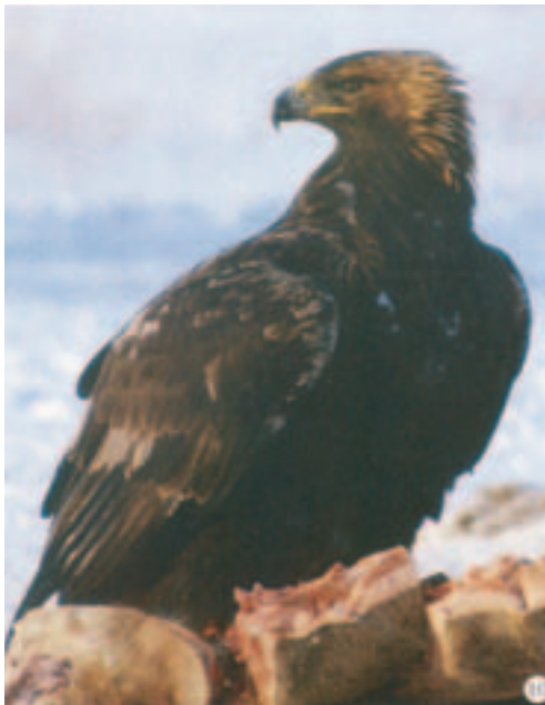
Foto 10. Typisk tegnet fugl. Overvejende mørk vingeoverside samt centralt beliggende lys række af store armdækfjer.