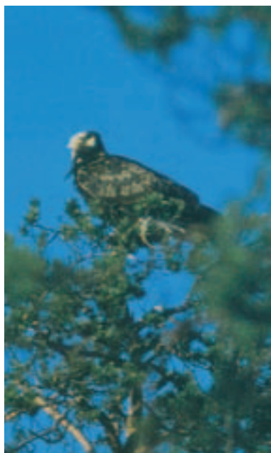
Foto 8. Ringmærket med kendt alder. Vingeoversiden har usædvanligt mange fældede fjer. Flertallet af de forreste (øverste) samt den bageste (nederste) række af små armdækfjer er mørke (fældede). En række af små dækfjer samt rækken af mellemste dækfjer fremtræder derfor som lyse bånd på vingeoversiden. Set flyvende kunne denne ørn let antages at være i tredje eller fjerde dragt. På nært hold afslører de ensfarvede (lige gamle) øverste store armdækfjer dog fuglens rette alder.