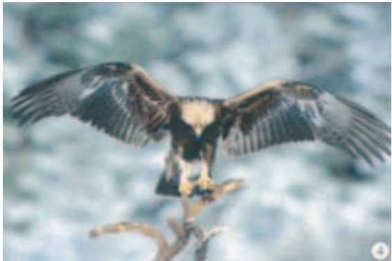
Foto 4. Fuglen har ekstremt afvigende vingeundersider med kun lidt hvidt og samtlige juvenile armsvingfjer og de seks inderste håndsvingfjer er tydeligt lys-båndede. Vingeoversiden mangler det hvide parti ved håndens basis. Bortset fra disse ting så er farvetegningen normal for en juvenil fugl. Dragten udseende fører tankerne til den sydeuropæiske race A.c.homeyeri .