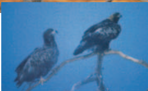
► Foto 28. Adulttegnet ørn. Formodentlig syvende dragt eller ældre. Til venstre en yngre Havørn.