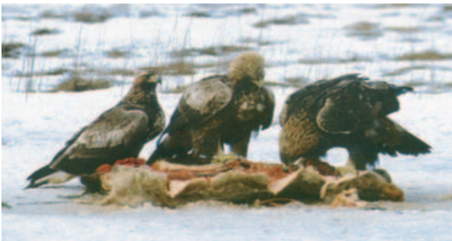
Foto 11. Typisk tegnet fugl i tredje dragt (til højre) sammen med to ligeledes typisk tegnede fugle i anden dragt.