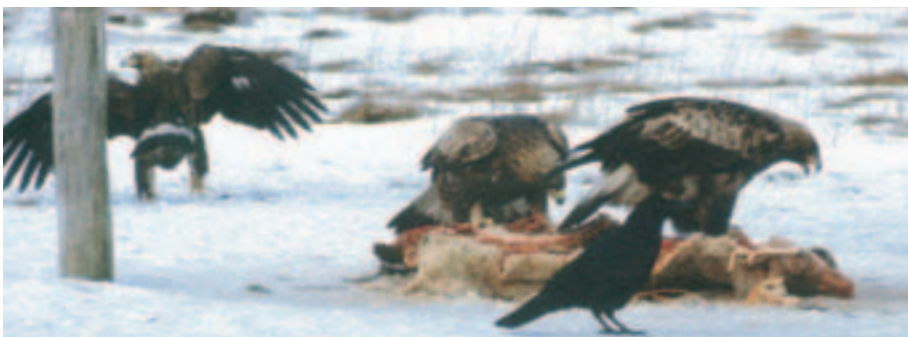
Foto 16 (til højre). Typisk tegnet fugl. Aflangt, lyst men noget mørkpletet øverste felt i vingedækfjerene i kontrast mod de hovedsageligt mørke, små dækfjer langs vingens forkant. Armdækfjer af forskellig alder, bl.a. en række mørke, nyfældede (der soarer til tredje dragts centralt beliggende lyse og slidte dækfjer). I midten en fugl i typisk anden dragt. Til venstre en juvenil fugl (første dragt) med forholdsvis lille, hvidt parti ved håndens basis og med bredt, sort terminalbånd på halen.