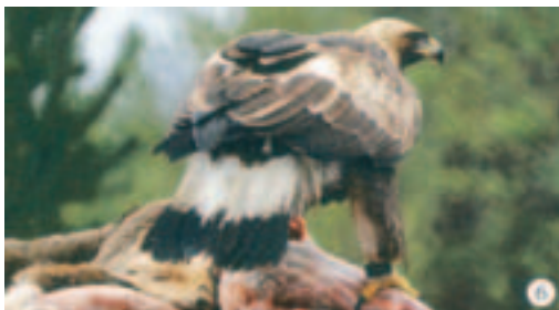
◀ Foto 6. Ringmærket med kendt alder. Typisk tegnet fugl. De store armdækfjer bliver gradvis lysere ind mod ryggen og har en mørkere (nyfældet) fjer inderst, som kontrasterer mod den afblegede fjer, der ligger ved siden af (meget almindeligt).