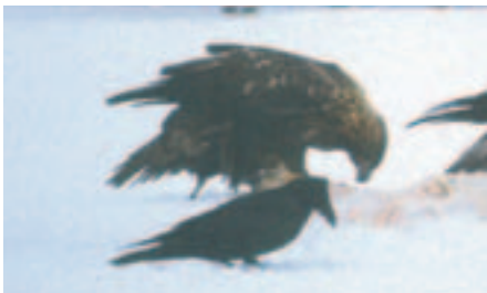
▲ Foto 24. Ringmærket med kendt alder. Samme ørn som på foto 13 og 23, men nu endnu et år ældre. Er nu næsten i fuld adultdragt. Læg mærke til, at sekvensen lyst – mørkt vingefelt stadig følges (her mørkt).

slag af hvidt eller gråhvidt tidligst ved syvende leveår. En ringmærket ørn i fjerde dragt, der blev aflæst ved ådsel, aflæstes samme sted i syvende dragt og var da i fuld adultdragt (foto 13 og 24). Derimod var halen hos en anden aflæst ørn i niende dragt stadig gråhvid på den inderste trediedel dvs. i princippet samme udseende som en fugl i sjette dragt (fig. 6B). Måske har enkelte individer af nominatracen A. chrysaetos en smal hvid halerod og måske endda synligt hvidt på de underste armsvingfjers basis gennem hele deres liv ??