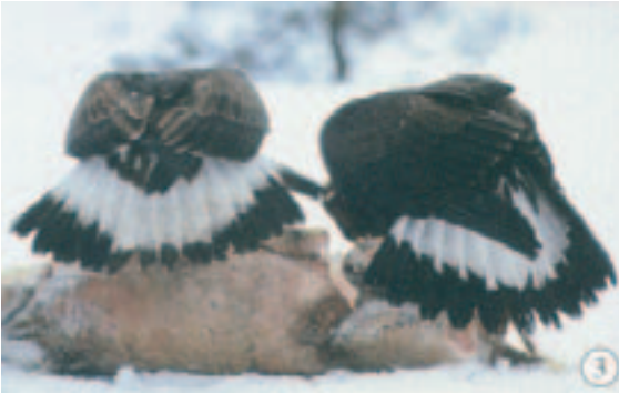
◀ Foto 3. Den venstre ørns hale har forholdsvis smalt sort terminalbånd og gråpletter, diffus overgang til den hvide del, medens den højre ørn har bredere terminalbånd med skarp grænse mod det hvide. Begge fugles vingeoversider er typiske for aldersklassen, men viser samtidig, hvor stor den individuelle variation i farven kan være.

Foto 4. Fuglen har ekstremt afvigende vingeundersider med kun lidt hvidt og samtlige juvenile armsvingfjer og de seks inderste håndsvingfjer er tydeligt lys-båndede. Vingeoversiden mangler det hvide parti ved håndens basis. Bortset fra disse ting så er farvetegningen normal for en juvenil fugl. Dragten udseende fører tankerne til den sydeuropæiske race A.c.homeyeri .