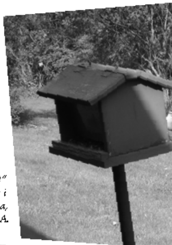
"Mit" fuglebræt i Pennsylvania, USA.

I min have, hvor der blandt andet serveres hampefrø, solsikkefrø, jordnødder og knuste valnødder, er navnlig Grøniriskerne glade for denne menusammensætning, men også mange andre fugle udviser her ved brættet en naturlig madglæde. Skovspurv, Sumpmejse, Musvit, Blåmejse, Grønirisk hører til de mest hyppige foderbrætspisere. Rødhalsene kommer, når menuen er lidt lækker, og det er knuste valnødder for dem. Grøniskenerne kommer, når det bliver for svært for dem at finde mad ude i naturen. Men så kommer der lige en Solsort, som rydder bordet for alt andet fjerkræ. Solsorten er ikke kræsen om vinteren. De bortflygtende må så sidde