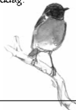
Tegning: Jens Frimer Andersen

Foruden Suler, kjoever og Mallemuk m.m., kan vi håbe på artige overraskelser som f.eks. stormsvaler og skråper. Ved 11-tiden runder vi hurtigt havnen og kigger efter Grå-/Hvidvinget Måge. Turen sluttet med en tur i koloni/fyrhaverne. På denne årstid er der ikke så mange fugle i haverne, men der er altid en lille chance for sjældenheder, såsom Fuglekongsanger, Rødtoppet Fuglekonge eller Hvidbrynet Løvsanger. Vi forventer at slutte omkring middag.