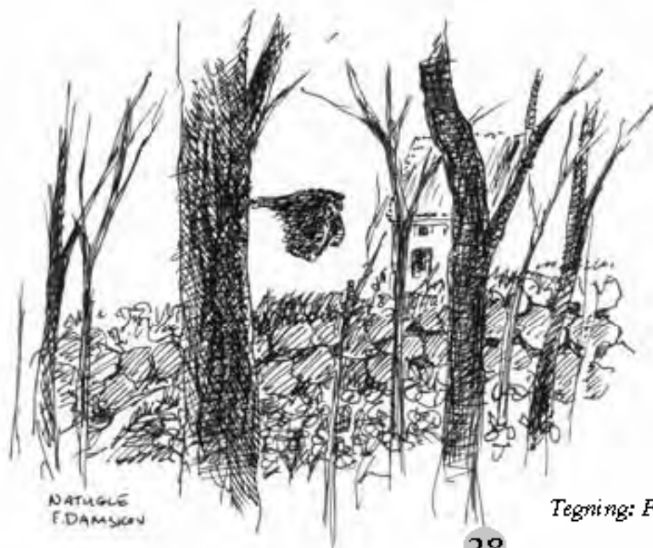
Tegning: Flemming Damskov