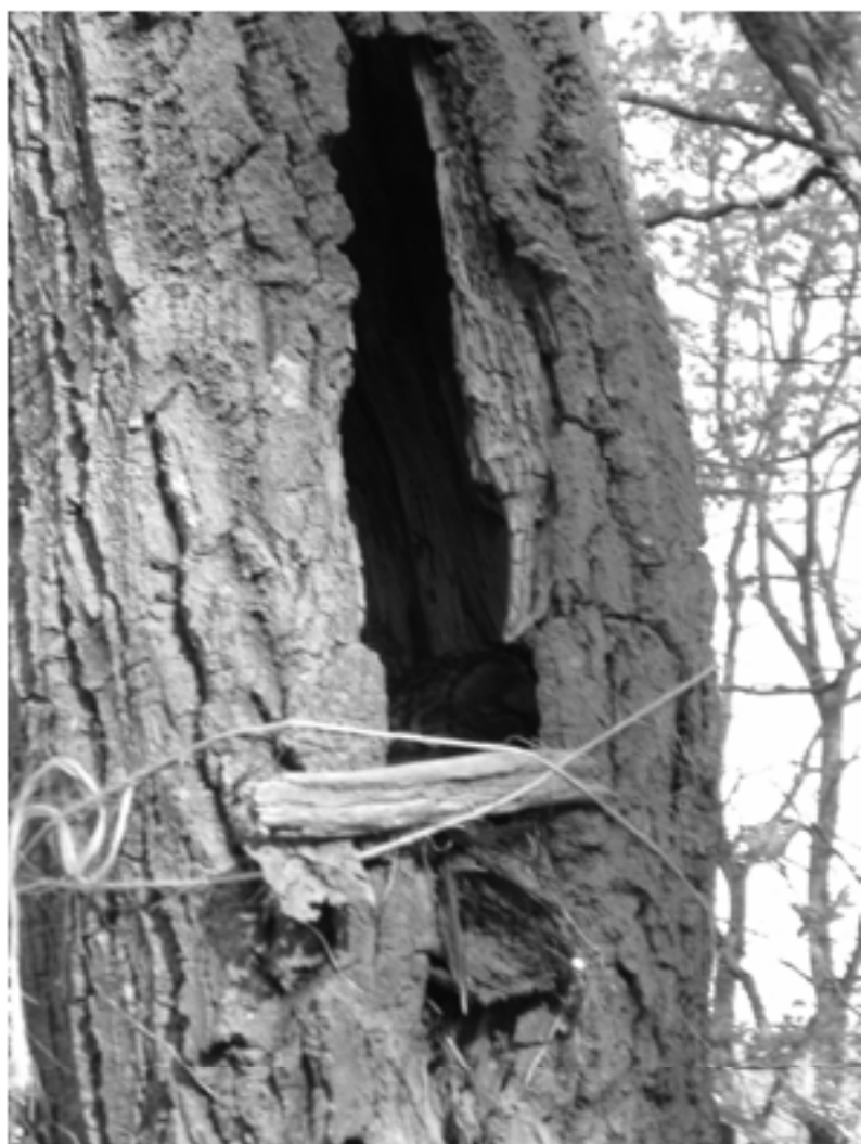
Uglereden før og efter opsætning af redningsgelænderet, der formåede at holde ungen i reden.