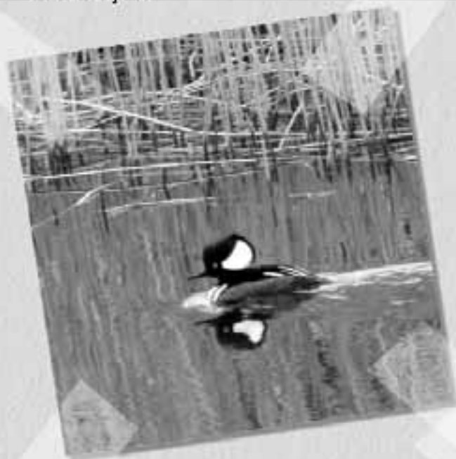
Hjelmskallesluger i Kastet Å