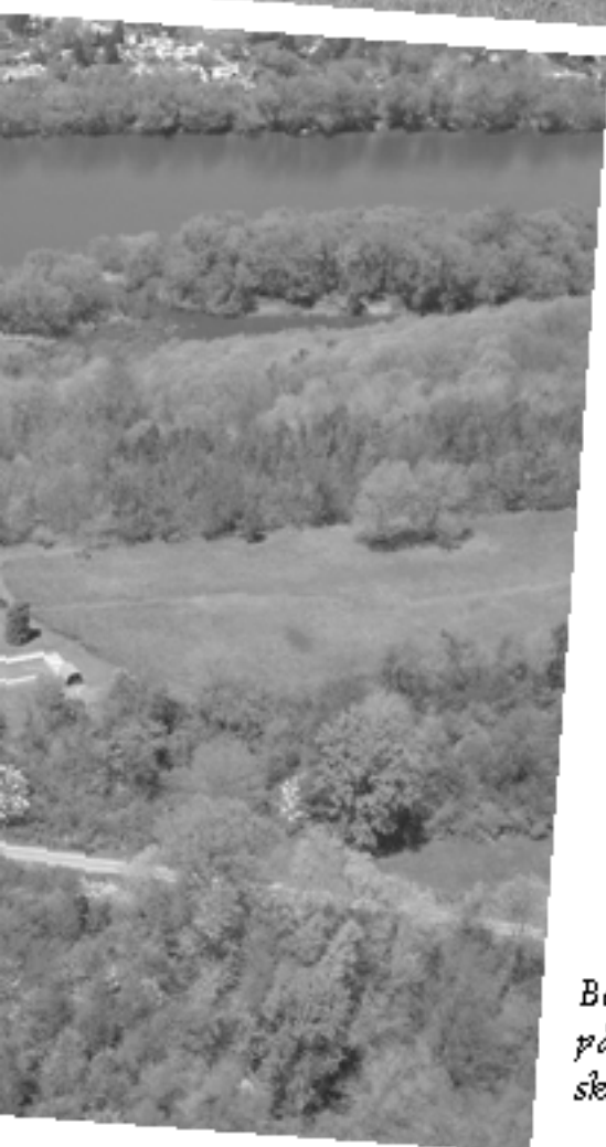
Beliggenheden på en skovklædt skråning.

i de nærmeste buske og afvente, at Solsorten har fået dækket sin madlyst. Dog forsøger Musvitterne sig med noget, der mest ligner et kommando-raid – hurtigt frem, tage en solsikkekerne og så væk igen. Det kan klares på lidt kortere tid end 1\frac{1}{2} sekund. Dompapperne og Kernebiderne kommer også på besøg, når de alligevel er i kvarteret. Topmejsen kommer en sjælden gang imellem. Det samme med Spætmejsen.