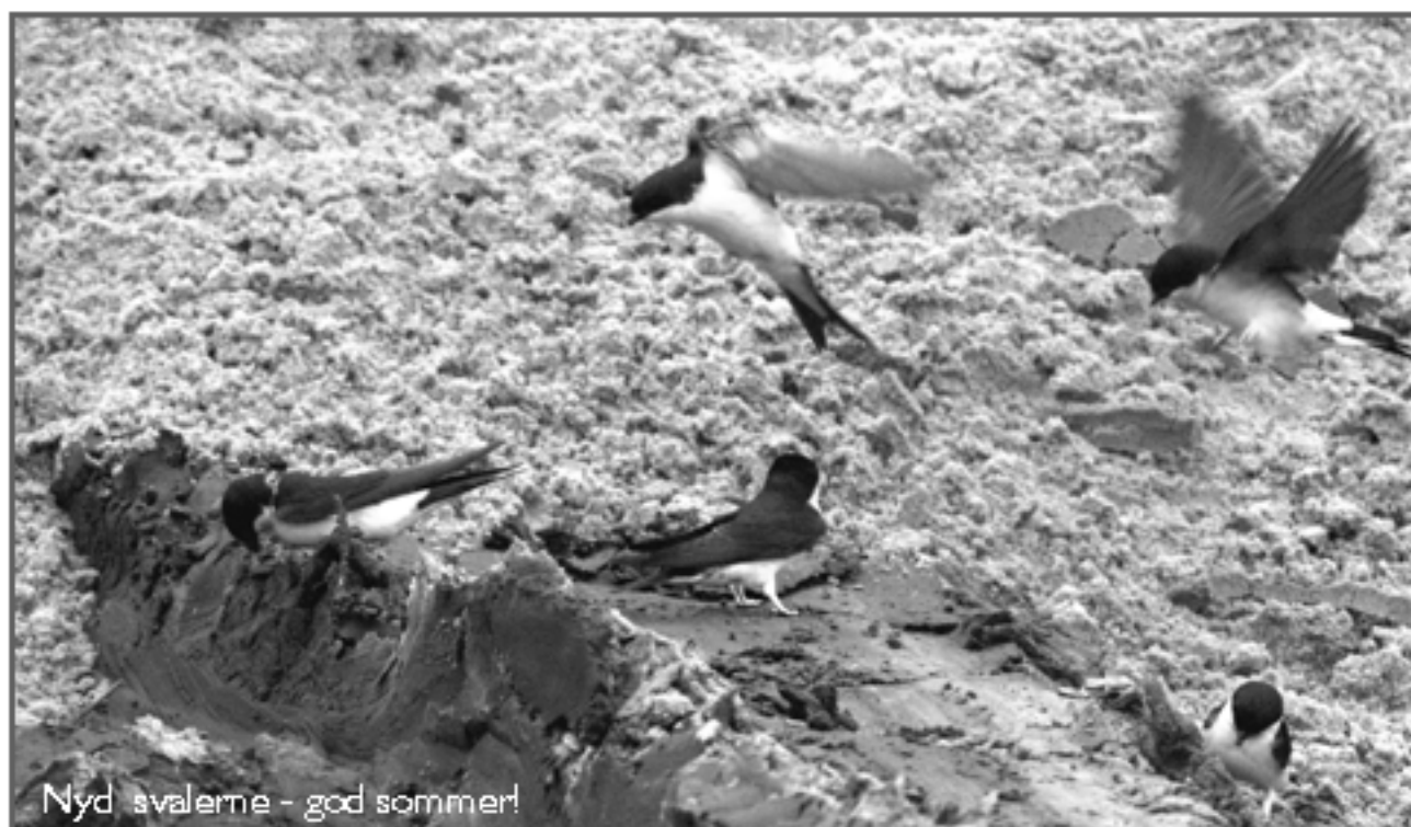
Nyd svalerne - god sommer!

I perioder med koldt vejr kan Bysvalerne have svært ved at finde føde, hvilket går ud over ungerne. De sulter, men kan så gå i en dvalelignende tilstand, hvorfra de vågner igen, når der bliver føde nok, hvis ikke de er sult et ihjel forinden. □