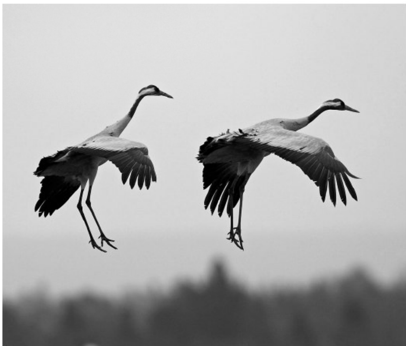
Et par af Hansted reservatets traner lægger an til landing