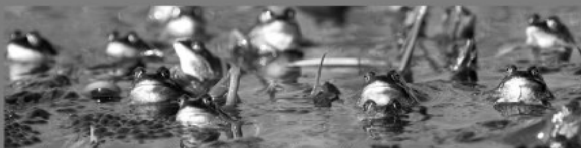
udsnit af sidste års vinderbillede af Ejnar Dahl Jensen