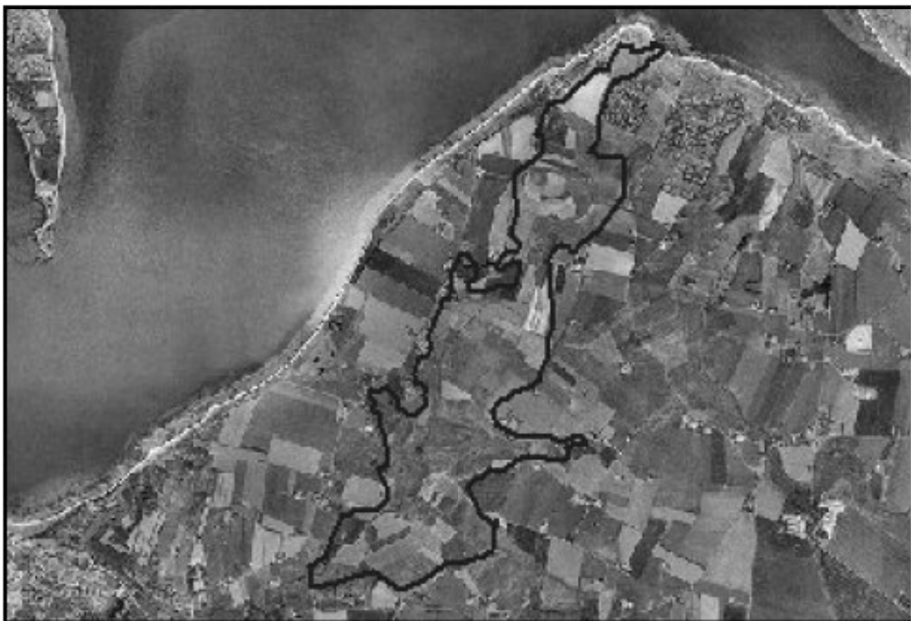
Luffoto med indtegnet projekt indtegnet.