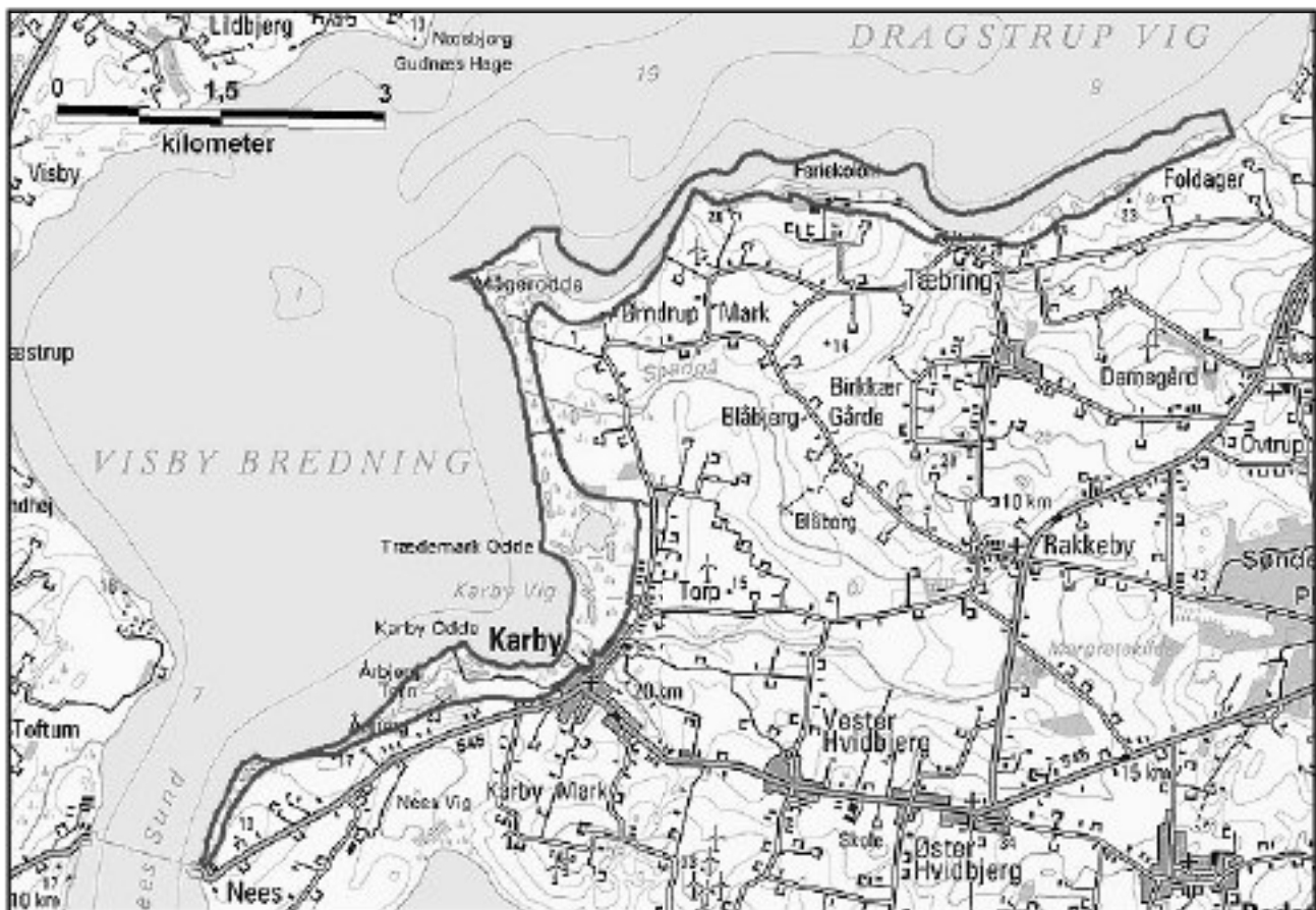
Fuglebeskyttelsesområde nr. 25 Mågerodde og Karby odde

Ejendommen er i det væsentligste en stor uforstyrret strandeng med fladvandede strandsøer og losystemer samt strandoverdrev på strandvold, og den afgrænset mod agerlandet af en ca. 10 m høj skrænt, hvorfra der dels er et fint udsyn ud over strandengene, dels er en meget flot udsigt ud over Visby Bredning og Dragstrup Vig.