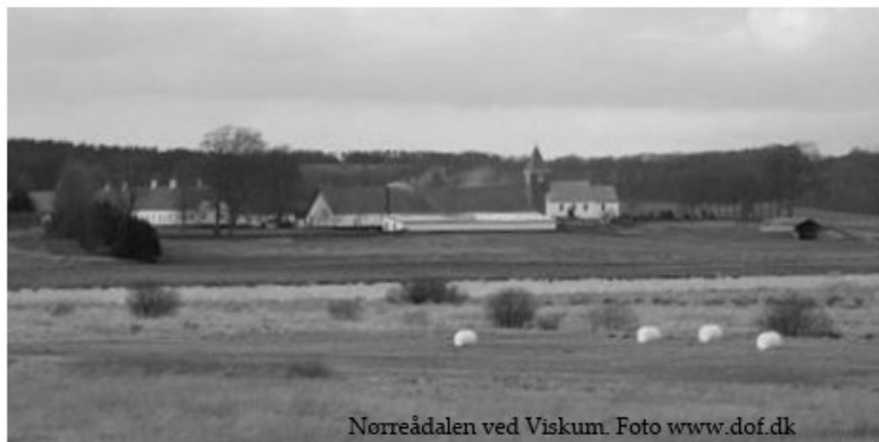
Nørreådal ved Viskum.

På næste side ses et par oversigter over vadefugleforekomsterne i de to områder. Skemaerne viser de størst registrerede antal af de forskellige vadefuglearter for hvert år. I enkelte tilfælde markerer symbolet * efter et tal, at arten det pågældende år kun er registreret som trækkende.